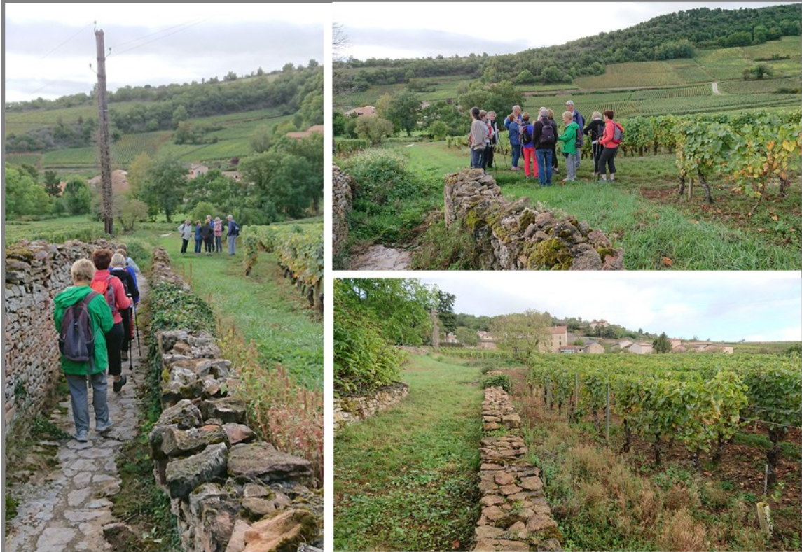
Ce chemin empierré nous plonge rapidement dans le paysage typique d'un vignoble réputé : le Pouilly-Fuissé.