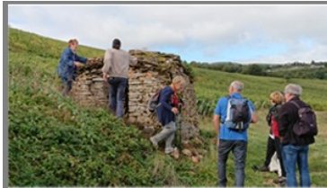
Restauration réussie d'une cadole, sœur jumelle de notre caborne des Monts d'Or.