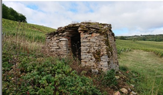
L'épierrement des parcelles les rendant ainsi cultivables, permettait de construire ces anciennes cabanes en pierres sèches, abris des vigneron.