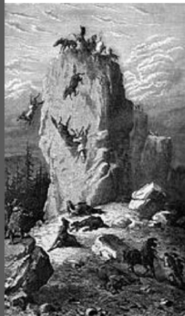
La légende illustrée par Alphonse Riballier

Le site de Solutré occupé depuis 55000 ans, a donné son nom à une culture du paléolithique supérieur : le Solutréen.